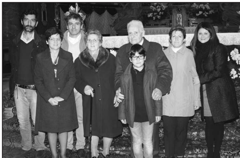
I bisnonni Dainesi con i familiari.