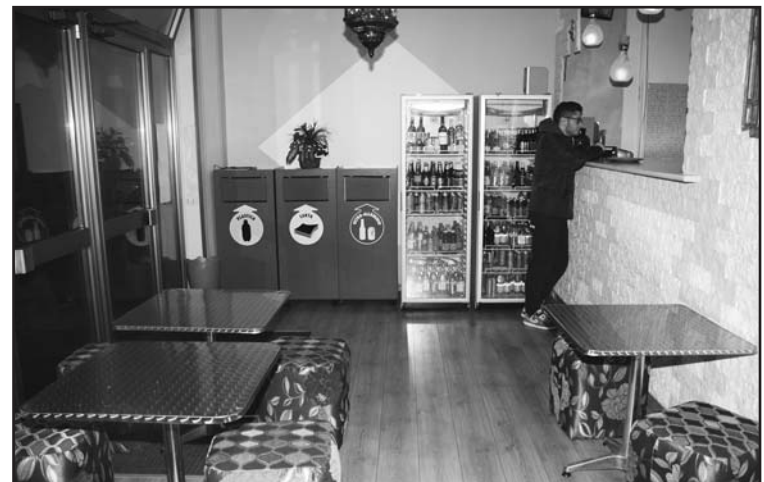
La zona riservata per consumazione kebab e panini.

Domenica dalle ore 12,00 -15,30 e dalle ore 18,30 alle ore 23,00